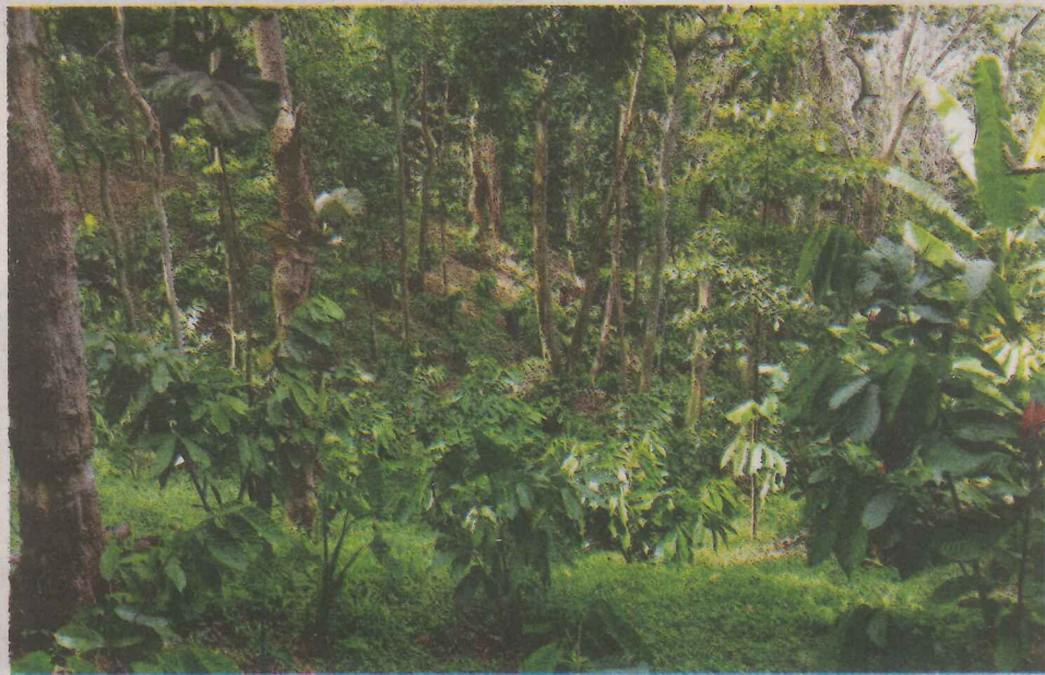
Finca de cacao en Maricao