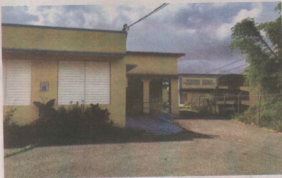
Escuela Segunda Unidad Francisco Vincenty

Como centro de gestión universal la Fundación Bucarabón se encuentra en el proceso de arrendar la escuela Segunda Unidad Francisco Vincenty localizada en el mismo Barrio Bucarabones.