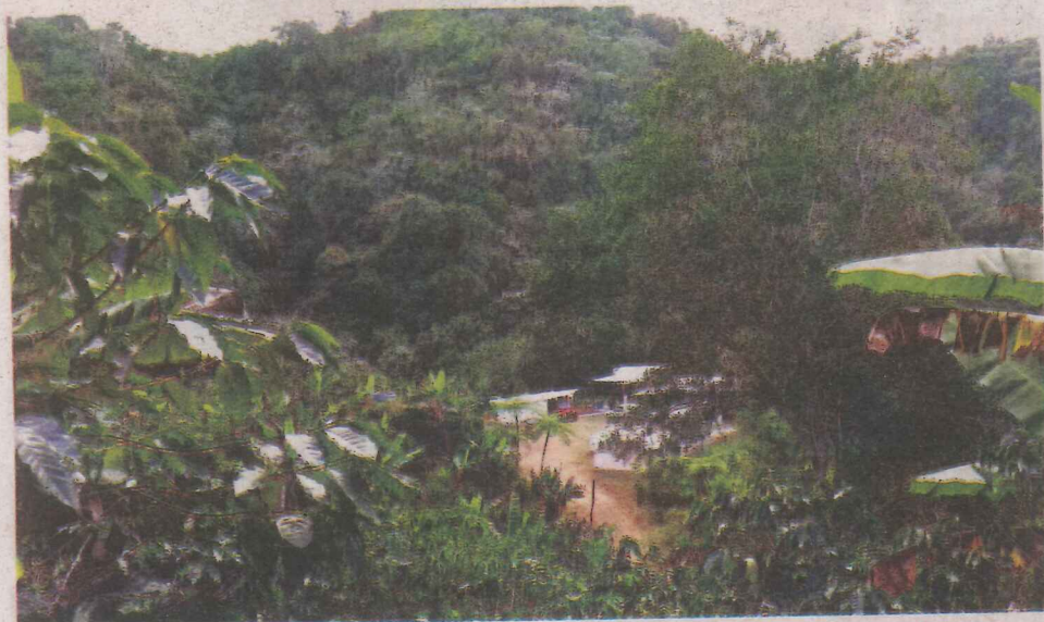
Finca y beneficiado de café en Maricao