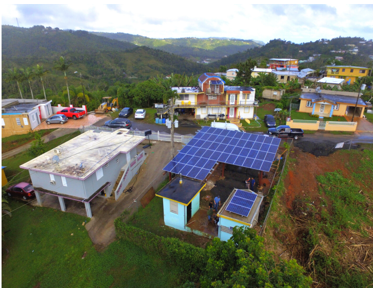
Comunidad Coruja, Inc. - Aguas Buenas

La Fundación Comunitaria de Puerto Rico (FCPR) es una institución filantrópica con 35 años de servicio, desarrollando las capacidades de las comunidades. Nuestro objetivo general es reducir la brecha de inequidad en las comunidades de Puerto Rico mediante la construcción de los capitales comunitarios: social, financiero, humano, físico, ecológico y cultural. Mediante este objetivo se estimula el crecimiento de los activos de la comunidad, como el agua, la energía y la seguridad alimentaria; fortaleciendo la autosuficiencia, el desarrollo económico, la seguridad del hogar y la educación. Nuestro trabajo incluye la ejecución de programas que atiendan las necesidades apremiantes de la comunidad. Como parte de nuestras iniciativas comunitarias, estamos en vías de implementar un proyecto de mitigación en comunidades rurales que manejen sus propios acueductos (NON-PRASA) dirigido a proveer sistemas de resguardo de energía.