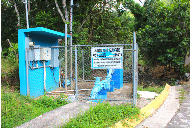
Acueducto Comunitario Algarrobo, Inc.- Aibonito