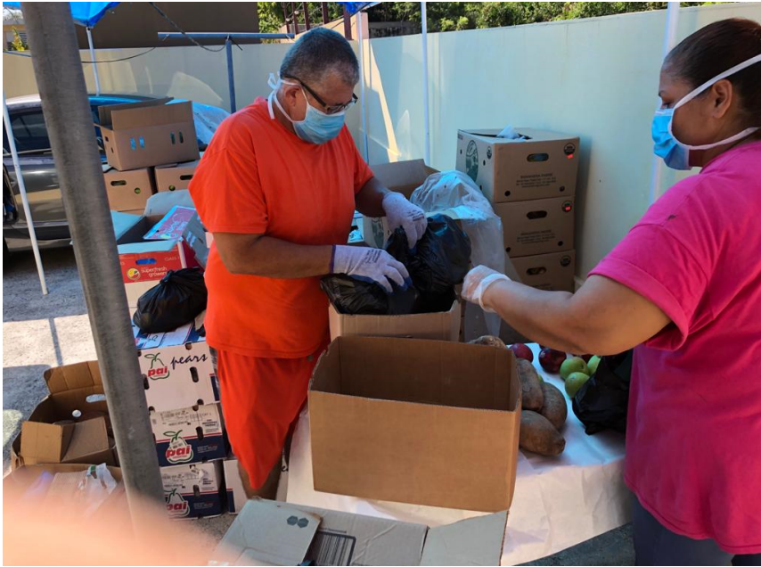
VAMOS Concertación Ciudadana en Guánica